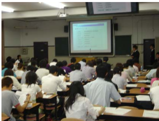
参加ゼミ説明会の様子

従来の説明会は運営側から言いたいことを学生に一方向的にしゃべるだけという形式になっていたが、今年は座談会を設けることにより、学生のほうから質問がしやすい場が提供できた。これにより参加学生がISFJでの活動の単純なイメージのみならず、それに伴う苦勞・それを乗り越えた達成感などの生の声も得ることができ、若い情熱をもった学生にいい刺激を与えることができたのではないかと。