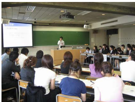
分科会での論文発表